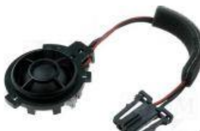
Obr.4 Výškové reproduktor