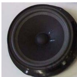
Obr.5 Širokopásmový reproduktor