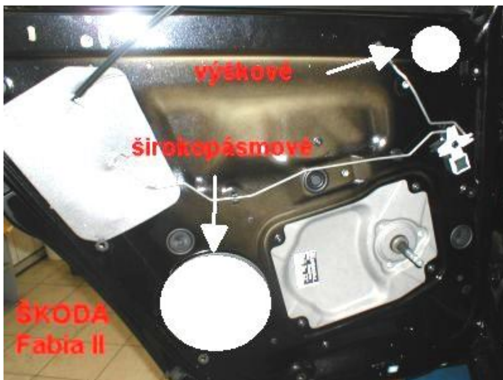
Obr.3 Umístění repro v zadních dveřích Fabia II